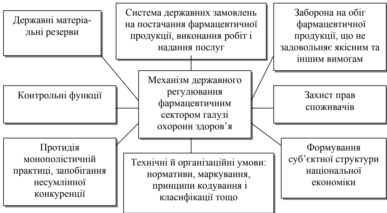
Рис.1. Механізм державного регулювання фармацевтичного сектору

Отже, механізм державного регулювання фармацевтичного сектору галузі охорони здоров'я являє собою сукупність інструментів державного впливу, що схематично представлено на рис.1.