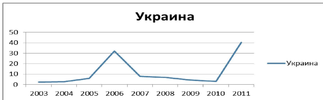
Рис. 2. Изменения коэффициента структурных сдвигов по годам в Украине.

Изменения коэффициента структурных сдвигов по годам в Украине приведены в графике на рис 2.