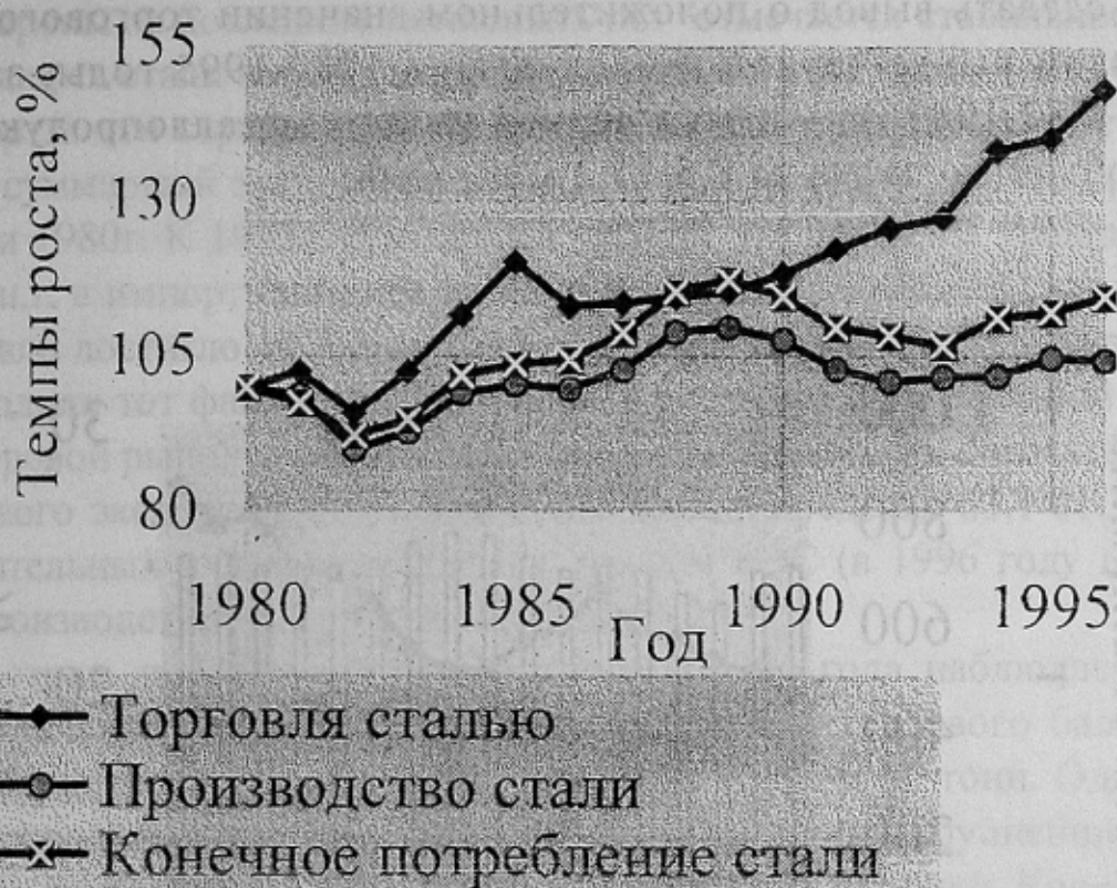
Рис.1 - Базисные темпы роста основных показателей мирового производства и потребления стали (к уровню 1980 г.)

190 млн. тонн в 1997г., при этом весь процесс характеризовался более ускоренными темпами роста (в пределах 3,5% - 8,5%), превышающими темпы роста производства и потребления стали (рис. 1), а средние темпы прироста объема мировой торговли за период с 1990 г. составили 5,2 %.