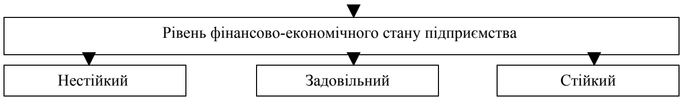
Рис. 2. Структурно-логічна схема визначення фінансово-економічного стану підприємства за динаміко-галузовим підходом

Згідно даного підходу розраховуються аналітичні показники конкретного підприємства і галузі, які необхідні менеджеру для розробки управлінських рішень; визначається інтегральний показник, що дозволяє на основі рейтингової оцінки фінансово-економічного стану порівняти стан конкретного підприємства із тенденціями функціонування галузі, а також розробляти стратегічні управлінські рішення щодо подальшого розвитку діяльності підприємства: