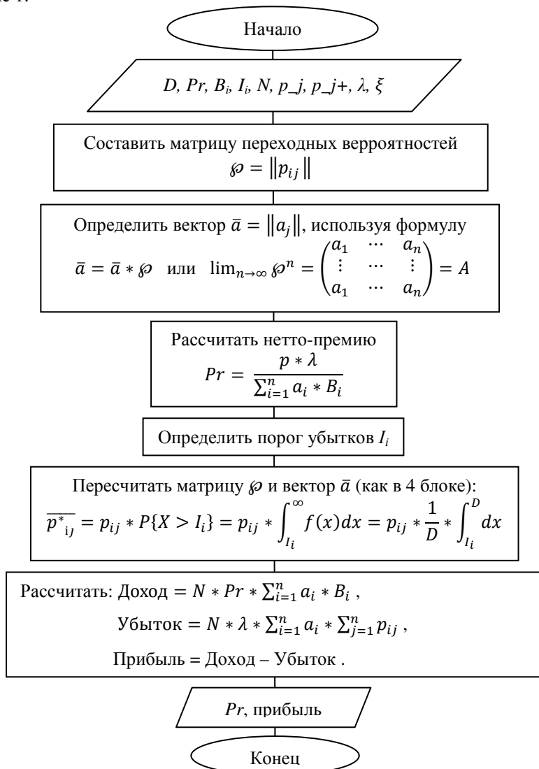
Рисунок 1 – Алгоритм расчета прибыли и нетто-премии

Для решения второй задачи, используя полученное распределение клиентов по группам и соответствующие скидки для каждой группы, рассчитывается прибыль страховой компании при данной системе бонус-малус. Алгоритм расчета прибыли страховой компании представлен на рисунке 1.