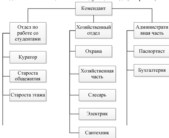
Рисунок 2 -Модель состава общежития

Модель состава общежития в следующем виде (см. рис. 2).