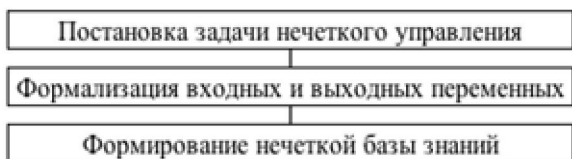
Рисунок 1 – Основные этапы разработки модели нечеткого управления на основе многомерных функций принадлежности

Основные этапы разработки модели нечеткого управления на основе термов с многомерными функциями принадлежности представлены на рис. 1.