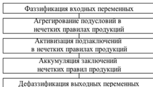
Рисунок 4 – Этапы нечеткого вывода

Формирование управляющих воздействий выполняется в соответствии с этапами, представленными на рис. 4.