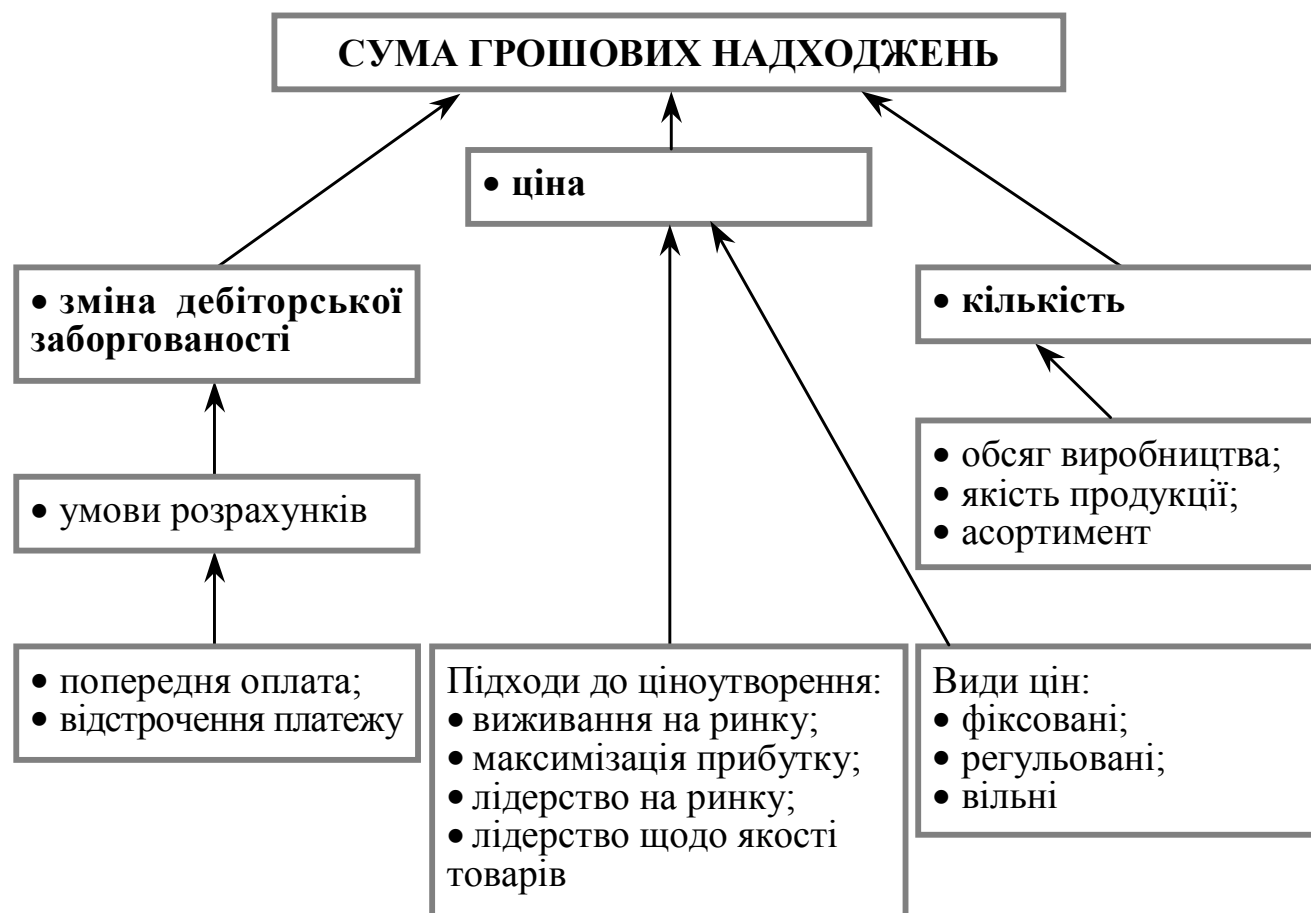
Рисунок 1.1 – Фактори, які впливають на суму доходу (виручки) від реалізації продукції, товарів, робіт, послуг

Виручка від реалізації продукції, робіт і послуг є основним джерелом відшкодування коштів на виробництво й реалізацію продукції, утворення доходів і формування фінансових ресурсів (рис. 1.1). За ринкової економіки обсягу продажу й виручці приділяється особлива увага. Від величини виручки залежить не тільки внутрішньовиробниче відшкодування витрат і формування прибутку, а й своєчасність і повнота податкових платежів, погашення банківських кредитів, які впливають на рівень виплачених відсотків, що в кінцевому рахунку позначається на фінансовому результаті діяльності підприємства цієї продукції.