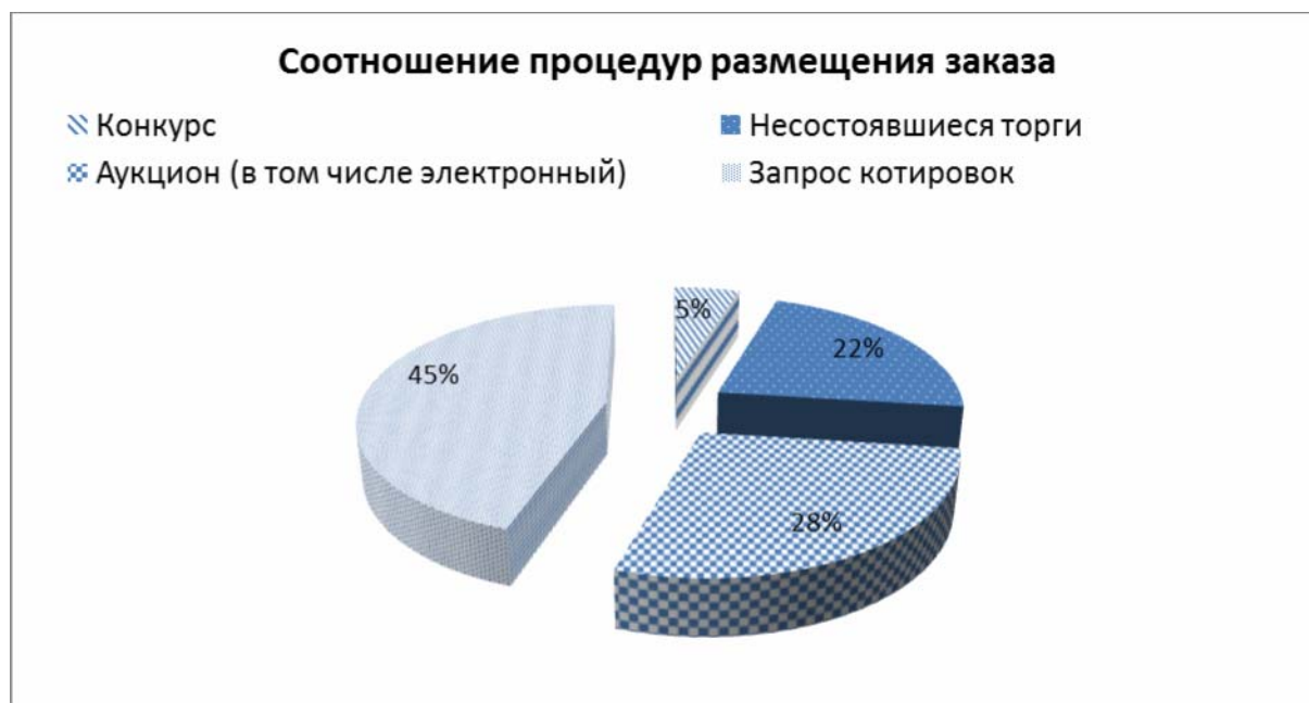
Рис. 1. Распределение процедур размещения заказа в 2010 году (по количеству процедур) 6

Проблема эффективного расходования государственных средств в государственных конкурсных торгах обусловила поиск дальнейшего направления институциональной трансформации институтов системы размещения заказов. Мнение о негативном воздействии на экономический рост и торговлю провалов регулирования в сфере госзакупок постепенно распространялось в российском правительстве. Кроме того, предполагаемое вступление России в ВТО требовало соблюдения трех обязательных условий: принятие контрактной системы, признание статуса государства с рыночной экономикой, а также создание соответствующего мировым стандартам рынка товаров и услуг. В этой связи опыт международных организаций в формировании системы правил государственных закупок оказал современным реформаторам неоценимую услугу 7 .