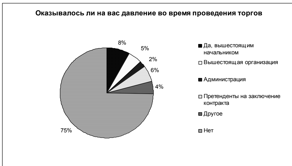
Рис. 3. Давление во время проведения торгов 18