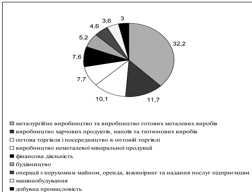
Рис. 1. Найбільш інвестиційно привабливі види економічної діяльності в Донецькому регіоні у 2010 році, %

Найбільш інвестиційно привабливими в регіоні за 2010 рік виявились такі види економічної діяльності, як металургійне виробництво та виробництво готових металевих виробів, в яке надійшло 32,2% від загального обсягу інвестицій, виробництво харчових продуктів, напоїв та тютюнових виробів (11,7%), оптова торгівля і посередництво в оптовій торгівлі (10,1%). Серед інших видів економічної діяльності, на розвиток яких залучається іноземний капітал, виділяються виробництво неметалевої мінеральної продукції (7,7%), фінансова діяльність (7,6%), будівництво (5,2%), операції з нерухомим майном, оренда, інжиніринг та надання послуг підприємцям (4,6%), машинобудування (3,6%), добувна промисловість (3%) [11].