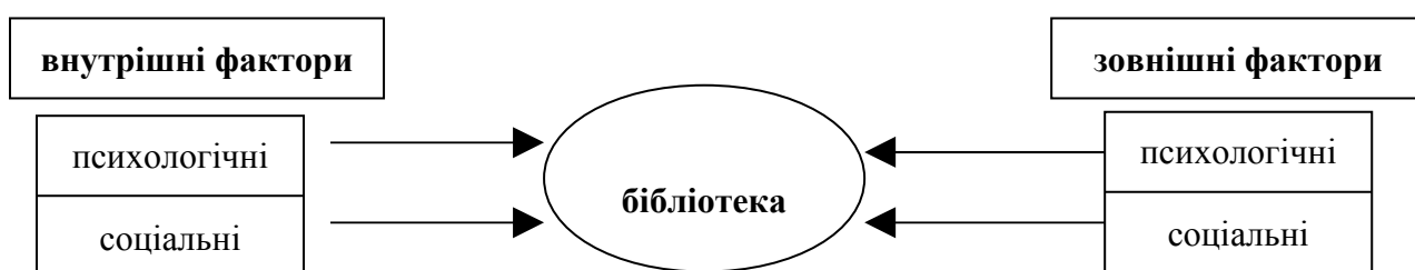
Рис.1.1. Фактори, що впливають на формування особистості бібліотеки

Бібліотека, як і будь яка соціальна інституція, є носієм унікального складу якостей, притаманних кожному її складовому елементу. Так, на формування особистості бібліотеки впливають два види факторів (рис.1.1) – психологічні (характер, тип НС, розумові особливості, здібності) та соціальні (релігійні, політичні погляди, уподобання, ментальність), вони можуть бути внутрішніми (відображення особистостей колективу бібліотеки) та зовнішніми (проекція якостей особистості читача та суспільства в цілому).