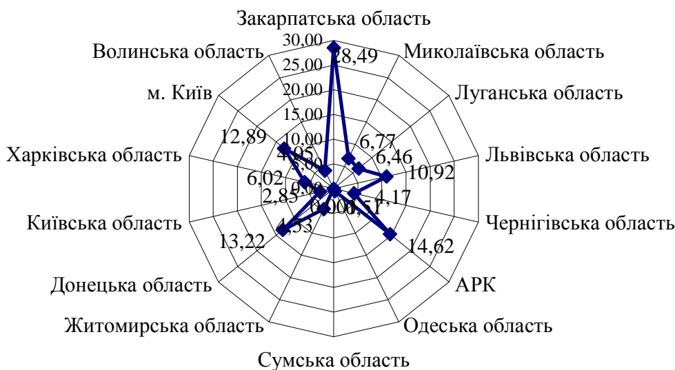
Рис. 1. Співвідношення інтегрованої питомої ваги впливу СЕЗ на розвиток регіонів України

Середня інтегрована питома вага їх впливу спостерігалася в Миколаївській, Луганській, Харківській та Житомирській областях (6,77; 6,46; 5,23; 4,53 % відповідно). Найменший вплив на регіональний розвиток здійснювали СЕЗ в Чернігівській, Волинській, Київській, Одеській та Сумській областях: 4,17; 4,05; 2,85; 0,51 та 0,001 % (рис. 1).