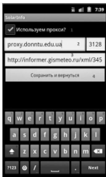
Рисунок 6. Экран настроек приложения.