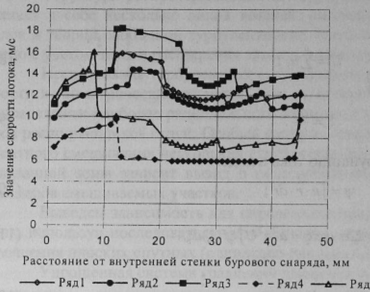
Рис. 2. Распределение скоростей потока в плоскости забоя скважины (до оси симметрии потока) Расстояние от плоскости насадки до забоя — 70 мм, внутренний диаметр колонкового набора — 90 мм, число гидромониторных отверстий — 6, диаметр центрального отверстия — 10 мм, диаметр оси расположения периферийных отверстий — 66 мм

1) в зоне, сформированной двумя одинаково-направленными струями, значение скорости смешанного потока превышает аналогичную величину, образованную в зоне турбулентного расширения струи;