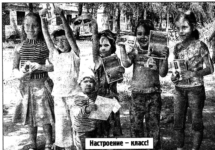
Настроение — класс!