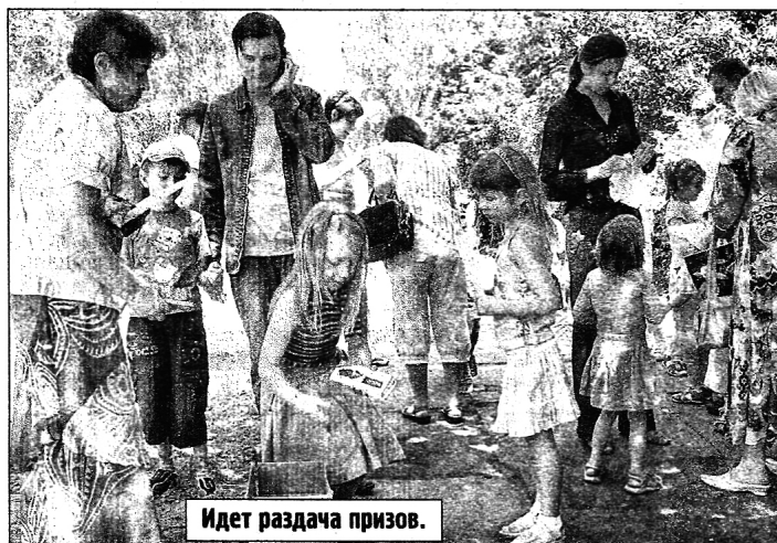
Идет раздача призов.