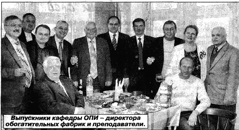
Выпускники кафедры ОПИ – директора обогатительных фабрик и преподаватели.