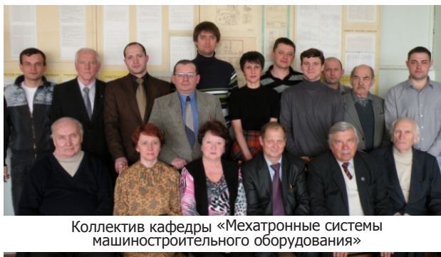
Коллектив кафедры «Мехатронные системы машиностроительного оборудования»

Все преподаватели кафедры ведут научные исследования совместно со студентами. По итогам научно-исследо-