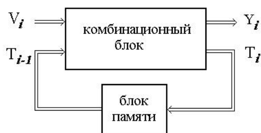
Рис.1. Модель синхронной последовательностной схемы.

Рассмотрим постановку трёх проблем построения различных типов входных последовательностей.