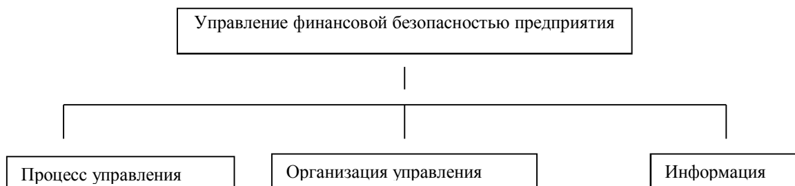
Рисунок 1. Сущность управления финансовой безопасностью предприятия

приятия, обеспечивающих высокий динамизм и вариативность принятия этих решений.