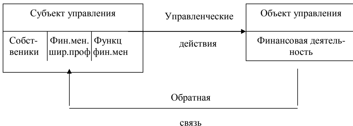
Рисунок 3. Единая схема управления (кибернетический подход)

Кибернетический подход к управлению основан на единой схеме управления, которая характерна для всех форм и видов управления, и изображен на рис.3.