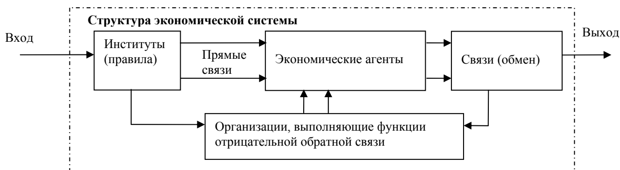
Рис. 1. Структурно-функциональная схема экономической системы