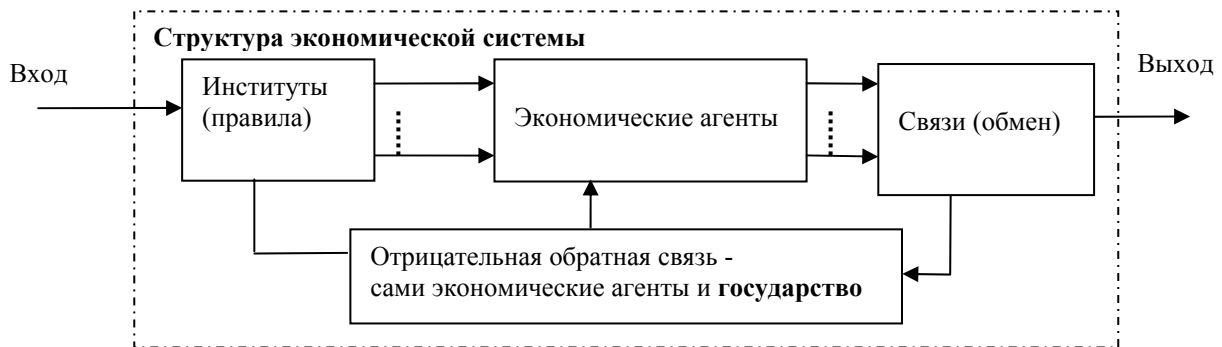
Рис. 3. Структурно-функциональная модель экономической системы (общий системный подход)

Роль государства с точки зрения общего системного подхода показана на рис.3.