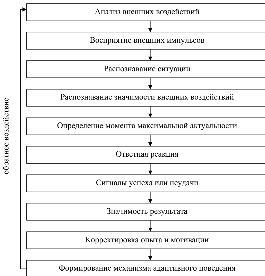
Рис. 2. Этапы формирования механизма адаптивного поведения фирмы

Особенности конкретной фирмы, определяющие постоянную составляющую в комплексном показателе адаптации, выражаются через оценку специфичности. Специфический ресурс – это ресурс, альтернативные издержки которого меньше дохода, который он приносит при наилучшем из возможных способов использования [1]. Количественная оценка степени специфичности ресурса основана на сравнении альтернатив его использования: