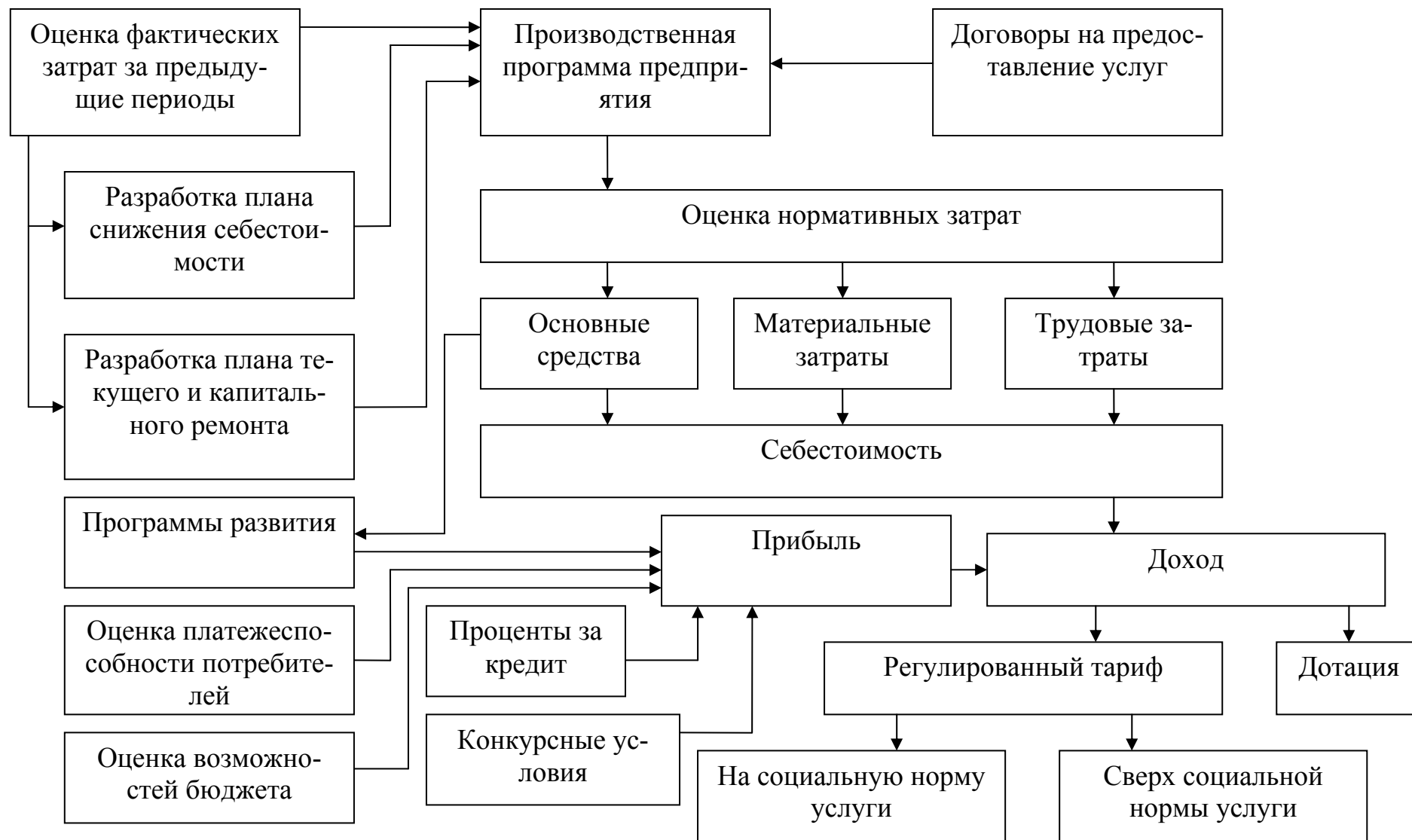
Рис.1. Алгоритм расчета тарифа на жилищно-коммунальные услуги