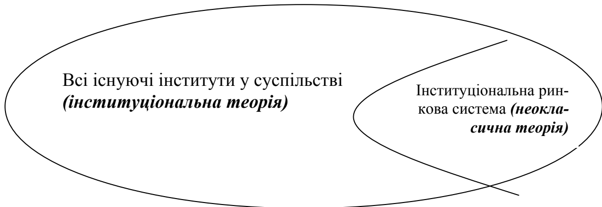
Рис. 2. Ступінь охоплення вивчення інститутів в інституціональній і неокласичній теоріях

про таких видатних інституціоналістів кінця XVIII – початку XIX ст., як А. Сен-Сімон, Дж. Грей та В. Вейтлінг, роботи яких стали фундаментом для написання Т. Вебленом своїх книг.