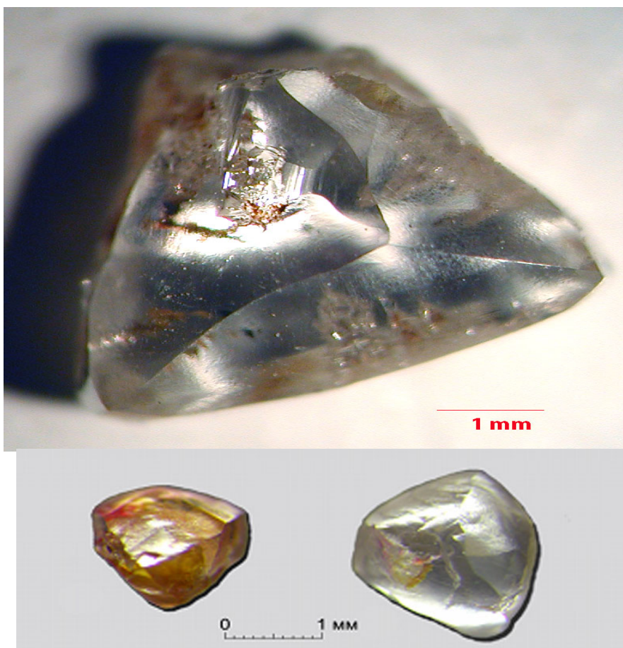
Рис. 3. Алмазы из кимберлитов трубки Лорелей.