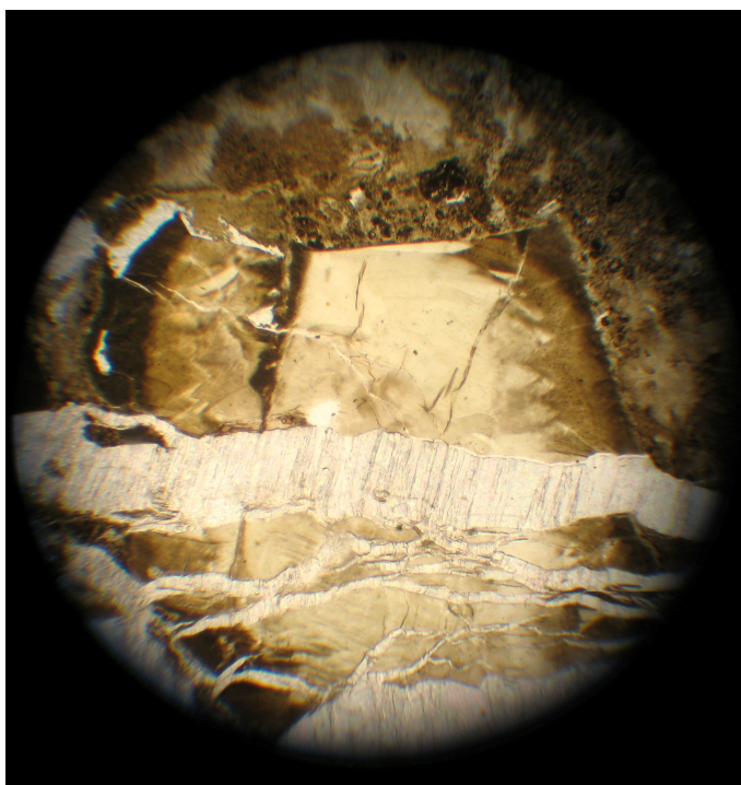
Рис. 1. Прожилки тальк-карбонатного состава, пересекающие порфировые вкрапленники серпентинизированного оливина в кимберлите. Свет проходящий, увел. 200

Среди кимберлитов трубки Лорелей отмечены некоторые разновидности, обогащенные флогопитом. В их составе отмечаются единичные порфиновые вкрапленники флогопита, серпентинизированные зерна оливина, оплавленные зерна трещиноватого граната.