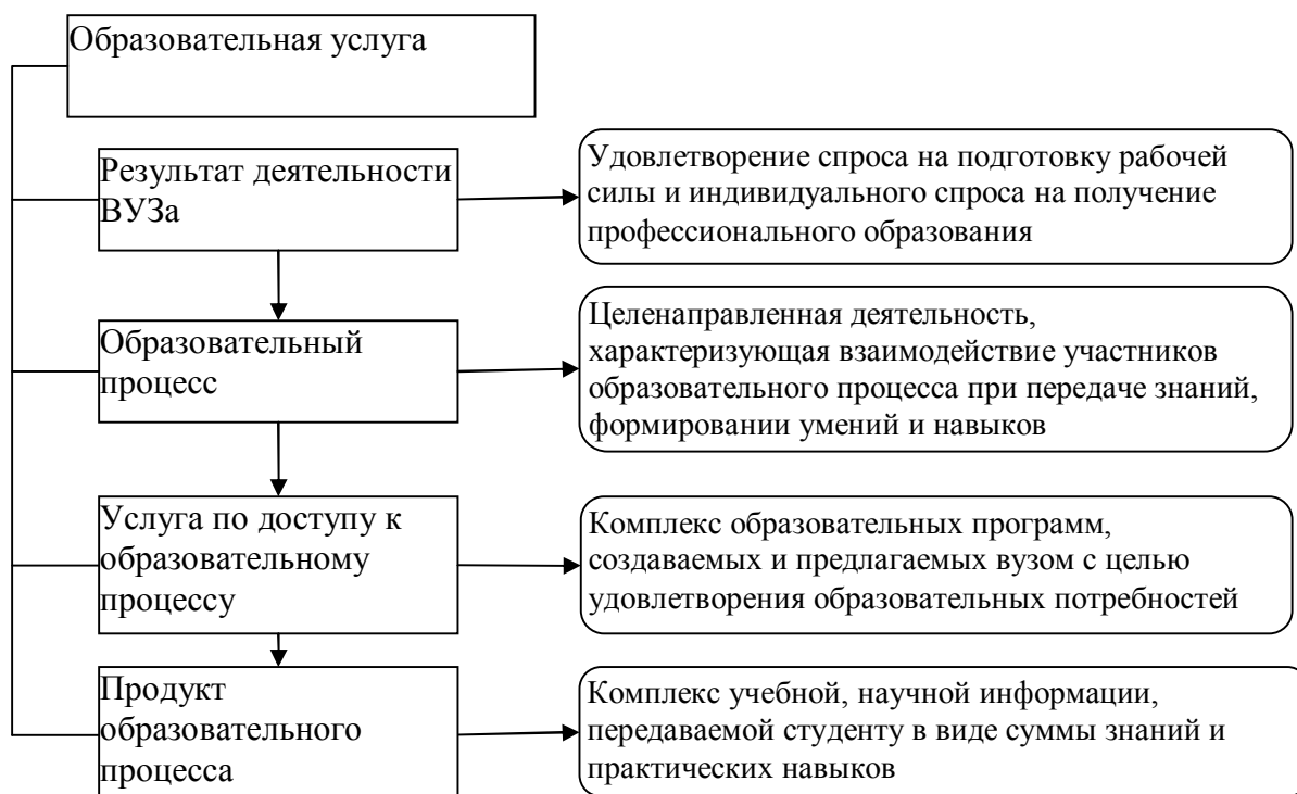
Рис. 2. Подходы к трактовке категории «образовательная услуга»

Качество – «степень ценности, добротности, пригодности, (положительное или отрицательное) свойство, существенные признаки, особенности, отличающие один предмет или явление от других» [12,с.266].