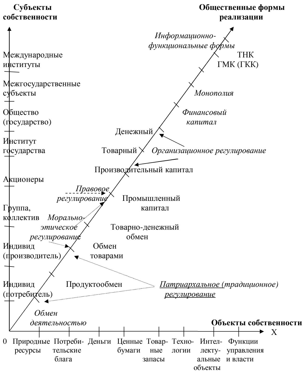
Рисунок 2. Политико-экономическая структура собственности

Из этой схемы также следует, что хозяйственное устройство каждого национального государства, из которого традиционная экономическая теория постулирует лишь принципы функционирования, весьма специфично по многим обстоятельствам и признакам. "Я упорно продолжаю считать, — пишет Ф. Бродель, — что решающим является общее движение, и что любой капитализм соответствует, прежде