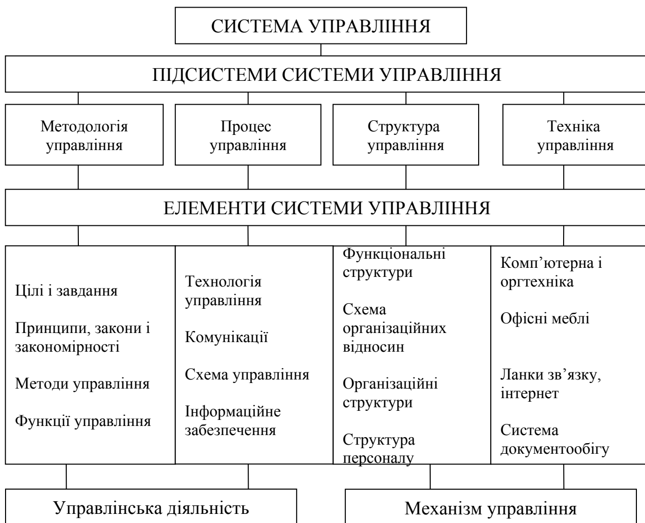
Рисунок 1 – Структура системи управління підприємством.

удосконалювання системи управління. Ці складові дуже важливі, але фіксують деякий етап стану системи управління і відбивають лише частину сучасної системи управління, що повинна включати елементи розвитку, у тому числі методологічну (управлінську) підтримку при розробці і реалізації рішень (рис.1)[3].